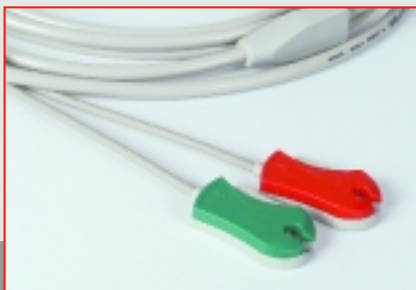
Câble patient ECG à 2 pôles