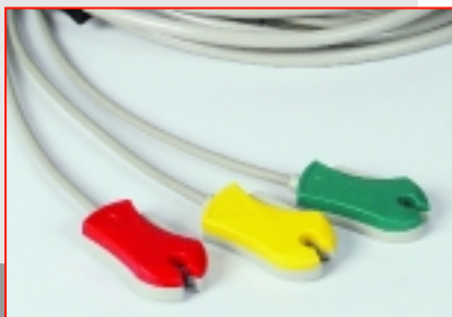
Câble patient ECG à 3 pôles