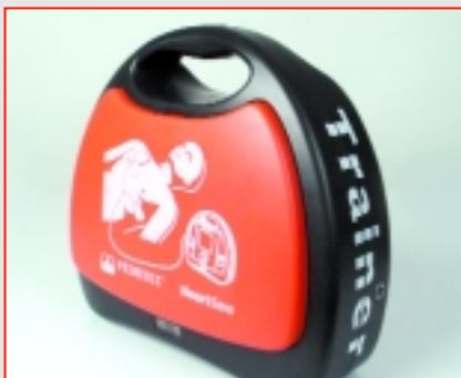
AED + AED-M sont également disponibles comme appareil d'entraînement