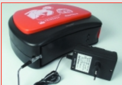
PRIMEDIC™ PowerPak, chargeur pour AkuPak