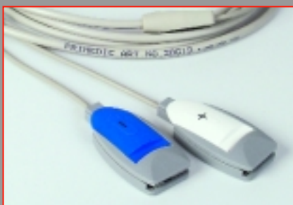
Câble de connexion SavePads