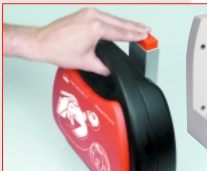
La fixation murale PRIMEDICTM éprouvée avec déblocage à une main seulement