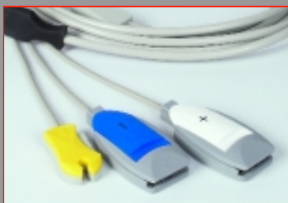
Câble de connexion SavePads Plus à 3 pôles