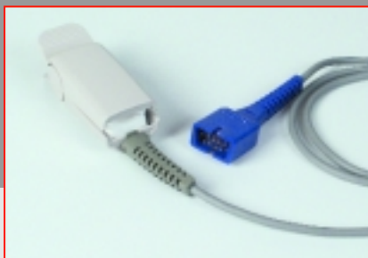
PRIMEDIC™ Nellcor capteur de doigt